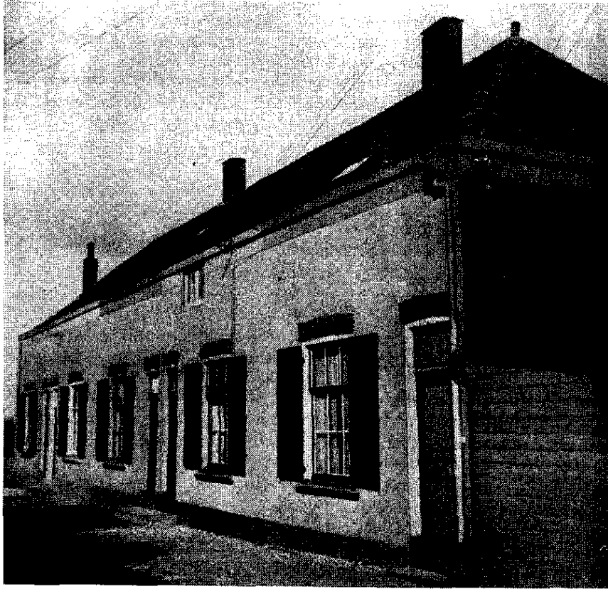
Het vroegere schoolgebouw, dat thans uit vijf woningen bestaat.