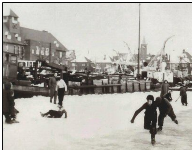
Dichtgevore haove broch uitkomst ...

D'n ingevaalle vorst broch uitkomst. De haove vroor al rap dicht en nae 'n paor daege zag ie de êêste 'ijsvissers' al 'n bijtjie hakke. Ze konnen 't nie aangesleept krijge en bij veul huishouwes sting in die daege gebakke vis op taofel. "Wà zij kanne, kenne wij ok!", wier d'r deur m'n zwaoger gedocht. Met 'n schepnetjie wiere de klaaine voortjies uit d'n bijt geschept. Effe laeter zwomme ze in 'n glaoze baksie, naest die van de snoek. Dut tò ze aan de beurt wazze om te verhuize. Wrêêd? Jaot, mor zôô gaot dat in de netuur. Doen wij d'r nie aan mee? Denk nog mor is aan die kreefte waer we 't al êêder over hadde... En de snoek? Die het 't uitaaindelijk nie gehaald. Van d'n honger kan 't nie gewist weze!