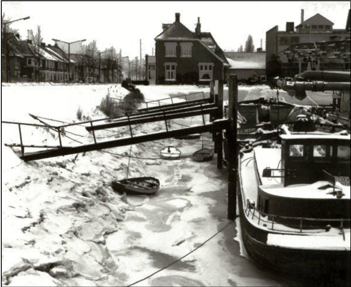
Winters beeld van de Sliedrechtse haven ...

Een winters plaatje uit het verleden van de Sliedrechtse haven. Werd het beeld vroeger bepaald door het baggermaterieel, nu overheerst daar de ‘vloot’ van de plezierjachten. Tijdens strenge winters werd er op het ijs van de haven door oud en jong vaak geschaatst.