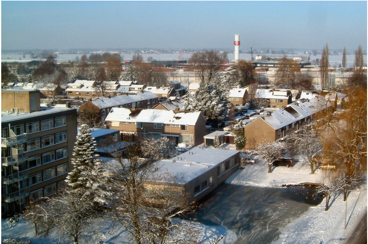
Uitzicht vanaf 't Rondeel over Sliedrecht ...

De Historische Vereniging heeft voor het jaar 2011 goede voornemens. We bestaan 30 jaar! Dat zal niet ongemerkt voorbijgaan. Reserveert u zaterdag 1 oktober maar alvast in uw agenda. Naast de jubileumviering verschijnen er ook weer enkele nieuwe uitgaven. Echt iets om naar uit te kijken !