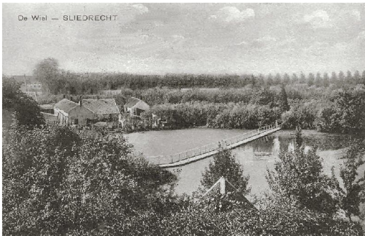
De Wiel aan het begin van de vorige eeuw ...